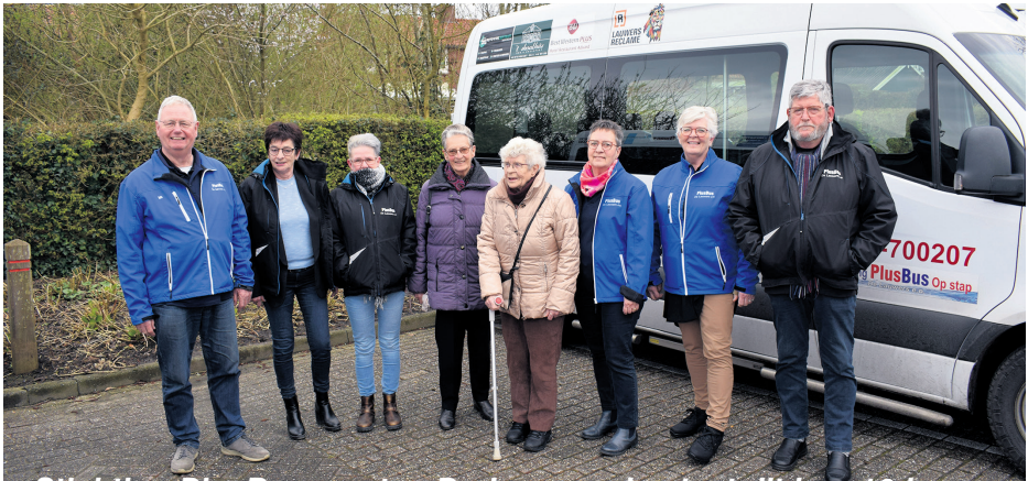
Stichting PlusBus op stap De Lauwers bestaat dit jaar 10 jaar